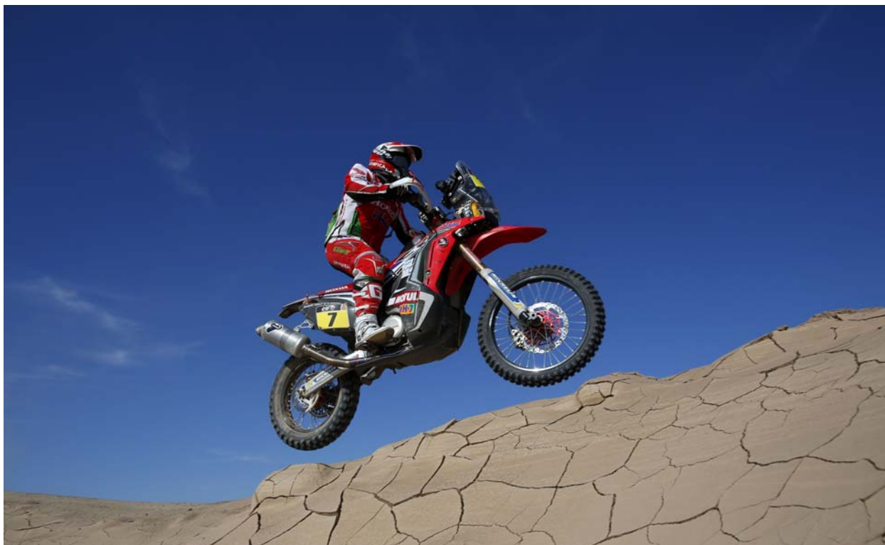
Der Portugiese Paulo Goncalves auf der CRF450 Rally

Frankfurt – Selten war eine Rallye Dakar (9000 Kilometer auf 13 Etappen durch Argentinien, Bolivien und Chile, noch bis zum 17. Januar 2015) so spannend. In der Motorradwertung haben die Honda Piloten fünf von neun Etappen gewonnen – in der Gesamtwertung liegt der Portugiese Paulo Goncalves auf der Honda CRF450 Rally mit nur fünf Minuten Abstand auf Platz zwei. Auf dem achten Rang: Laia Sanz aus Spanien – die beste Frau im Feld, die bereits im vergangenen Jahr die beste Teilnehmerin war, 2014, damals als Gesamt-14.